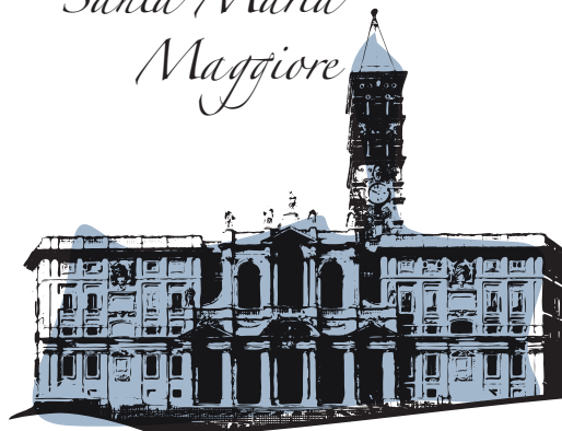
Santa Maria Maggiore